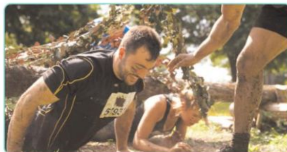
het zwaar te verduren krijgen