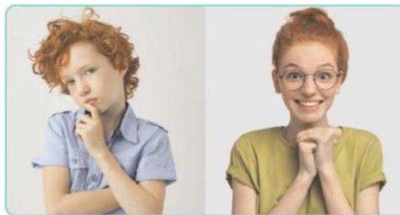
iets gemeen hebben